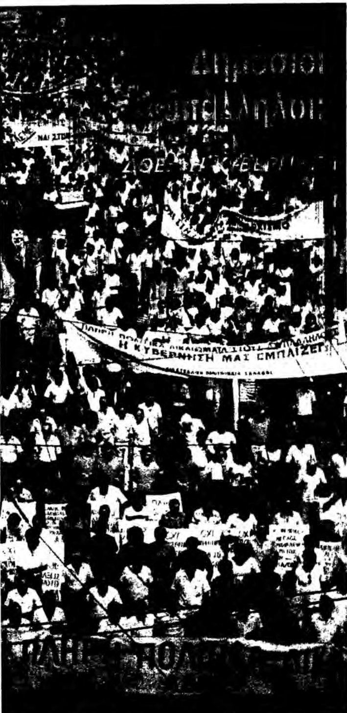
Στιγμιότυπο από την πορεία των δημ. υπαλλήλων στη Βουλή (29.9.87) την ημέρα της 24ωρης απεργίας.