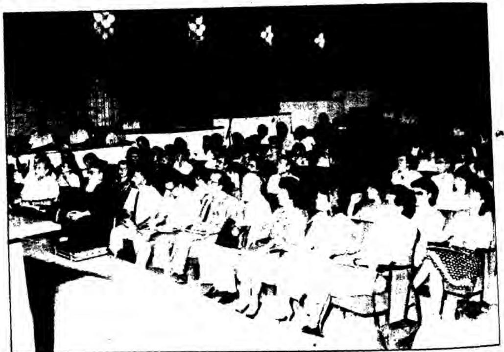
Στημιότυπο από το Α' Πανελλήνιο Συνέδριο για την Ειδική Αγωγή στη Νάουσα. (9-11 Σεπτεμβρίου 1987).