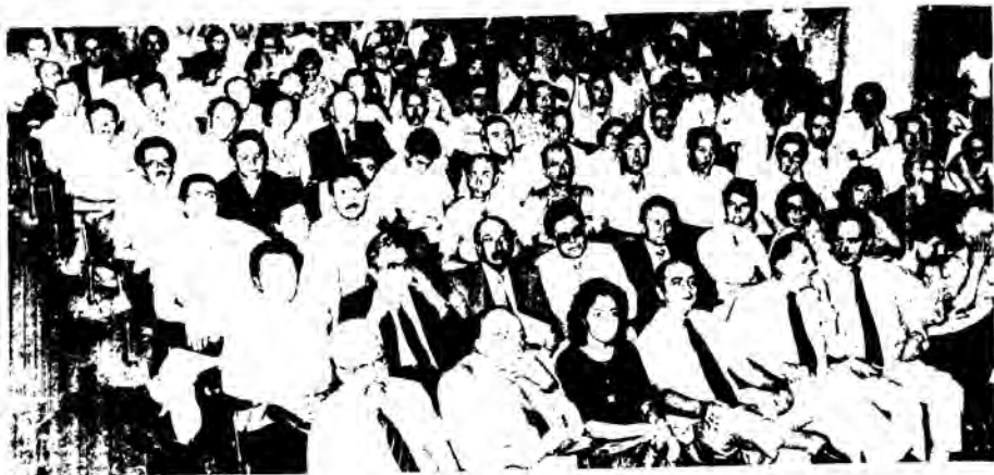
Στηνμύοτυπο από τήν 50η Γ.Σ. Διακρίνεται στήν πρώτη σειρά: ο Βουλευτής του ΠΑΣΟΚ κ. Μ. Δρεπτάκης, ο εκπρόσωπος της παράταξης Κέντρου, η Βουλευτίνα του Κ.Κ.Ε. κ. Μ. Δαμανάκη, ο Βουλευτής του ΠΑΣΟΚ κ. Βασ. Παπαδόπουλος, υπηρεσιακοί παράγοντες του Υπουργείου Παιδείας, σύμβουλοι του ΚΕΜΕ κ.ά.