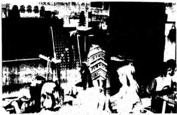
Το ΑΡΙΘΜΗΤΗΡΙΟ ΓΕΡΟΥ

οās βοθηθεί να ξεπεράσετε εύκολα τὰ δύσκολα σημεία στὴ διδασκαλία καὶ στὴ ἐμπέδωση τῶν μαθηματικῶν ἐννοιῶν ὅλων τῶν τάξεων. Στέλνεται ἀπὸ Βαλτινῶν 24 Αθήνα τηλ. 6466201, Τιμές: Μαθητῶν 150, 250, 300, Δασκάλου: ἐπίτιχο 2.500, σέ ὀρθοστάση 3.500.