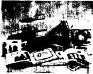
Αναγνωστικό-ακουστική μέθοδος άγγλικής γλώσσας