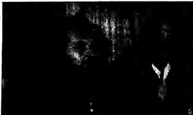
Από τη συνέντευξη τύπου στις 21.10.85 ο Πρόεδρος και ο Γενικός Γραμματέας της Ε.Ε. της ΑΔΕΔΥ.

ζ. Σύγκληση νέου Γ.Σ. τις αμέσως επόμενες ημέρες στο οποίο η ΑΔΕΔΥ θα κληθεί να εκτιμήσει τα αποτελέσματα των μέχρι τότε διαπραγματεύσεων για να αποφασίσει για την κλιμάκωση των ενεργειών της, αν μέχρι τότε δεν έχει υπάρξει προώθηση και προσπάθεια επίλυσης των προβλημάτων που προσδιορίζονται με βάση τις προτεραιότητες που έχει καθορίσει το συνδικαλιστικό μας κίνημα.