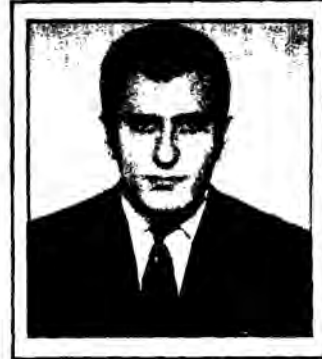
Παντ. Σοφιανός 7ου Δ.Σ. Αράμ. Υποψήφιος Ανακλη- ρωματικός Κ.Υ.Σ.Δ.Ε.

Προς τους Συναδέλφους Δασκάλους και Νηπιαγωγούς της χώρας Σ υ ν ά δ ε λ φ ο ι