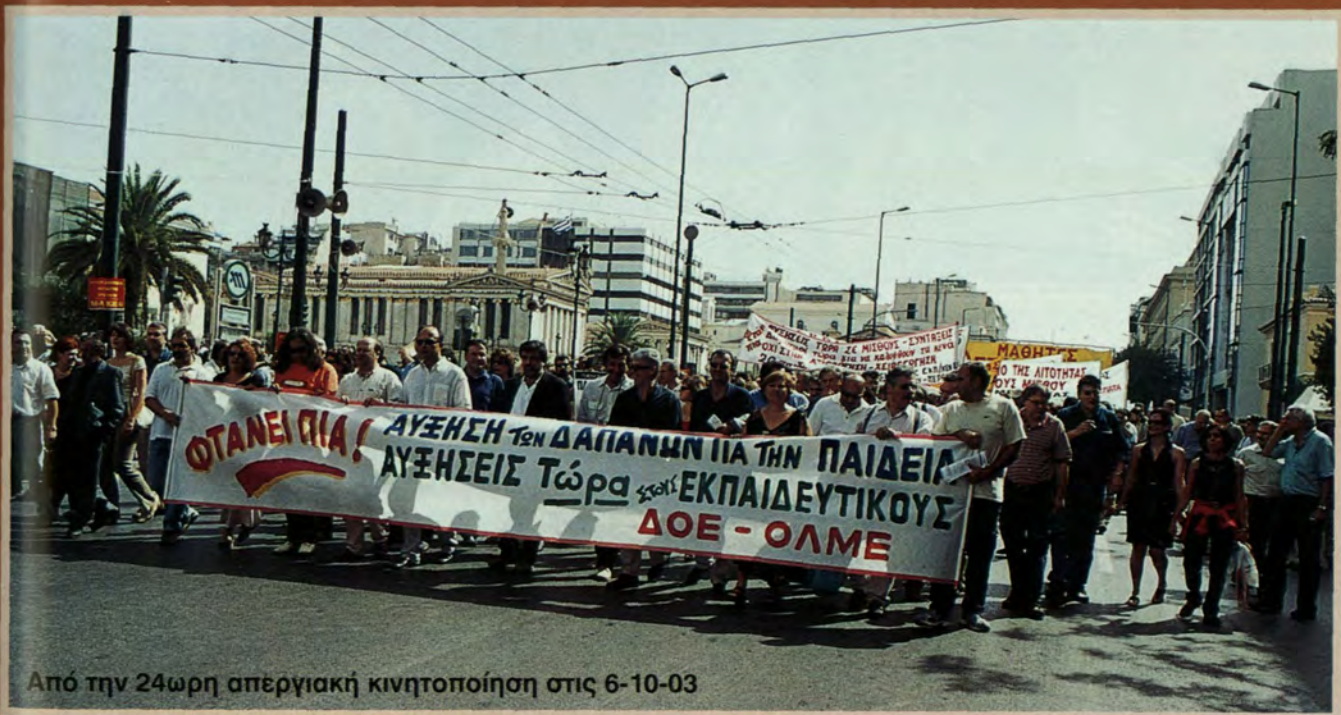
Από την 24ωρη απεργιακή κινητοποίηση στις 6-10-03

Η συμμετοχή όλων σ' αυτόν τον αγώνα είναι ζήτημα τιμής για τον κλάδο μας. Ας μην ξεχνάμε ότι μέχρι σήμερα: