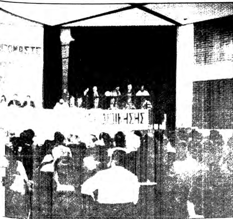
στο ίδιο το μισθολόγιο των Δ.Υ.