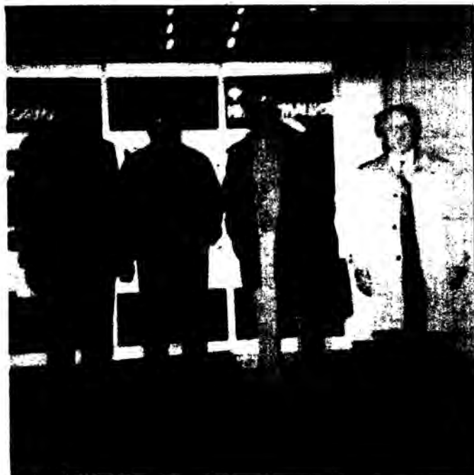
Η αντιπροσωπεία της ΔΟΕ με τους υπεύθυνους διεθνών σχέσεων του Σοβιετικού Συνδικάτου.

Όμως αρχίζουμε τη συνοπτική παρουσίαση των Σχολείων, ξεκινώντας από την προσχολική αγωγή.