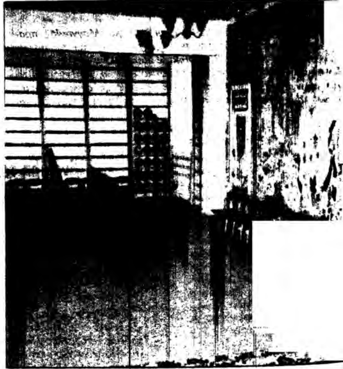
Πλευρές της αίθουσας μουσικής του 8ου νηπιαγωγείου στο Βλαδιμίρ της Ρωσίας

• Πέντε εκατομμύρια από τους παραπάνω, είναι οι εκ-