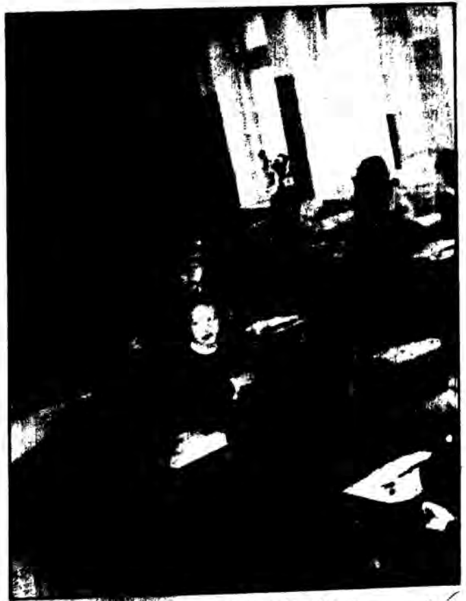
Άποψη της Α' τάξης του Γεν. Σχολείου σε σχολείο της Μόσχας.

Εκείνο που ιδιαίτερα εντυπωσιάζει, είναι ότι πέρα από το σχολικό πρόγραμμα Εκπ/σης υπάρχει ολόκληρο σύστημα για την καλύτερη δυνατή αξιοποίηση του ελεύθερου χρόνου των παιδιών.