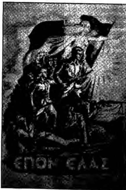
Αφίσα της εποχής αφιερωμένη στα νιάτα της εθνικής αντίστασης.

ΕΚΤΥΠΩΣΗ ΛΙΘΟ-ΘΥΣΕΤ ΕΛΛΑΣ Κ. Αδακτύλος Ακαδημίου 13 Τηλ. 5222.916 - 5230.701