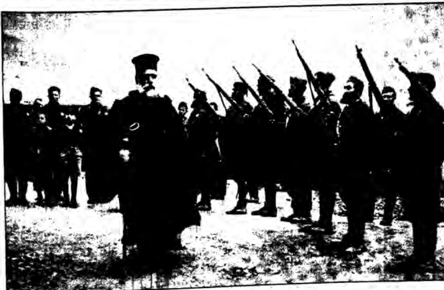
Αντάρτες παρουσιάζουν όπλα στον αγωνιστή ιεράρχη μητροπολίτη Κοζάνης Ιωακείμ.

Τα παιδιά και τα εγγόνια των αγωνιστών της Εθνικής Αντίστασης «τοις κείνων ρήμασι πειθόμενοι», ξεσηκώνονται ενάντια στη δικτατορία. Το οργανωμένο αντιστασιακό κίνημα τσαλακώνει το μύθο της δήθεν «φιλελευθεροποίησης» του καθεστώτος της 21ης Απριλίου που επιχειρεί ο δικτάτορας Παπαδόπουλος δια του Μαρκεζίνη. Και επιταχύνει