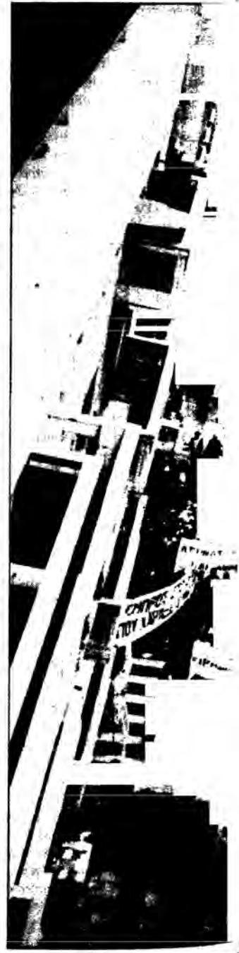
Από τη μεγαλειώδη πορεία του Αθηνά

— Ενισχύει την ΕΦΕΕ με το ποσό των 20.000 δραχμών για την αντιμετώπιση των εξόδων διοργάνωσης των γιορταστικών εκδηλώσεων.