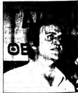
Ο πρόεδρος της ΑΔΕΔΥ κ. Δ. Κίτας.

Οποιαδήποτε απόπειρα σύνδεσης μεμονωμένων ατόμων με την πορεία και την τύχη των αιτημάτων των εργαζομένων στο δημόσιο -σήμερα, όχι μόνο απέχει από την πραγματικότητα αλλά υποδηλώνει ξεκάθαρα πως ορισμένοι είτε έμειναν με τις εντυπώσεις του παρελθόντος, όπου πραγματικά αυτά συνέβαιναν, είτε συνειδητά επιχειρούν