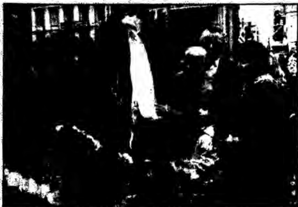
Η ΔΟΕ καταθέτει στεφάνι στο χώρο του Πολυτεχνείου.

Το δίδυμο της ακατάβλητης ελληνικής ψυχής