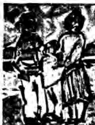
GUTENBERG - ΠΑΙΔΑΓΩΓΙΚΗ ΣΕΙΡΑ

Gutenberg με πρόλογο του Χρήστου Φράγκου, αναφέρεται στους κυριότερους σταθμούς της νεοελληνικής εκπαίδευσης από το 1821 μέχρι σήμερα.