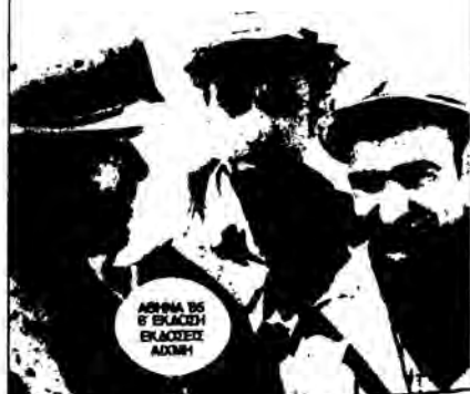
ΑΡΘΡΟ 15 6' ΕΚΔΟΣΗ ΕΚΔΟΣΕΙΣ ΑΙΧΜΗ

ΣΥΓΧΡΟΝΑ ΠΡΟΒΛΗΜΑΤΑ ΤΟΥ ΕΡΓΑΤΙΚΟΥ ΚΙΝΗΜΑΤΟΣ