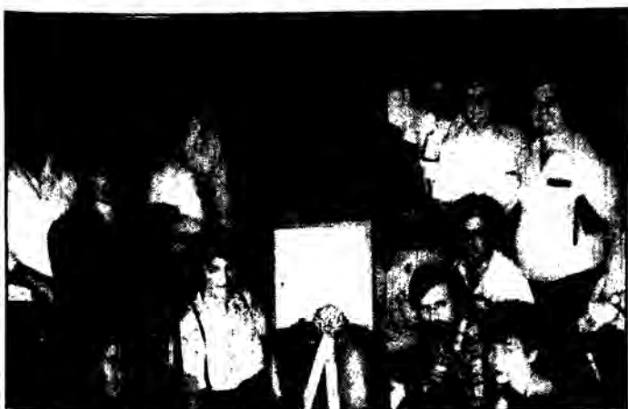
Στην εικόνα από την κατάθεση στεφάνιου στον Τάφο του Εθνάρχη Μακάριου.

Στις 22 και 23 Απρίλη 1989, έγινε με επιτυχία στην αίθουσα της ΠΑΣΥΔΥ στη Λευκωσία, το Γ' Πανελλήνιο Εκπαιδευτικό Συνέδριο των Ομοσπονδιών ΠΟΕΔ-ΔΟΕ-ΟΜΕΚ-ΟΛΤΕΚ-ΟΛΜΕ με θέμα: