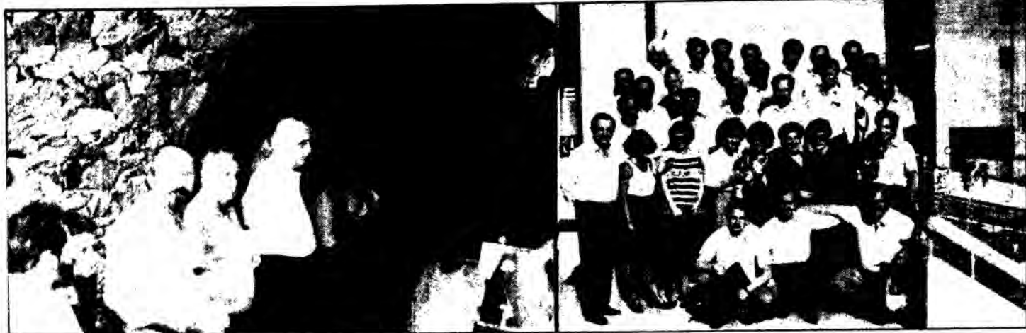
Στημιότυπα από την κατάθεση στεφανίου στον Τάφο του Εθνάρχη Μακαρίου