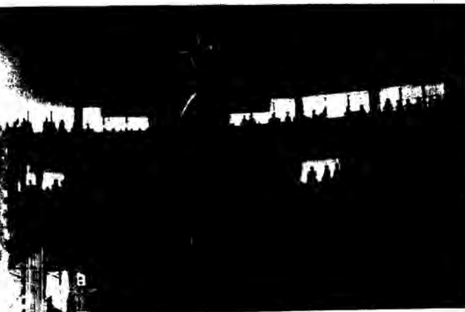
Φωτ. «Η ΓΑΡΣΣΑ ΜΟΥ» μπροστά σε 4000 θεατές του Βεροού. (φωτ. Απ. Τσακαλίδης).