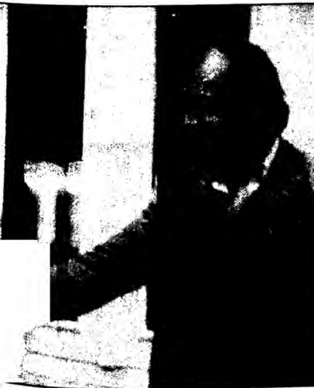
...ίτιος συγγαίρει τον διάδοχό του, πρώτο πρόεδρο της ΑΔΕΔΥ

Πιστεύω, όμως, πως αν δεν αναδεχτούν τέτοιες προοπτικές που να δίνουν διέξοδο στα προβλήματα των εργαζομένων, να ξεπερνούν τις σημερινές αδιέξοδες, πράγματι, καταστάσεις, με τις έντονες αντιπαραθέσεις, τις κατευθυνόμενες αντιθέσεις και παλώσεις, οδηγούμαστε σίγουρα σε αδρανοποίηση και περιθωριοποίηση στελεχών και μεγάλου τμήματος της βάσης. Αυτή η κατάσταση είναι πράγματι επικίνδυνη αφού τελικά και αναπότρεπτα υποβαθμίζει το ρόλο του σ.κ. Υποβαθμίζει κάθε δυνατότητα συμμετοχής, παρέμβασης, αξιόματης κριτι-