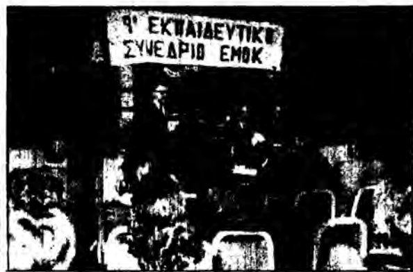
Στιγμιότυπα από την εναρκτήρια τελετή του 9ου Εκπαιδευτικού Συνεδρίου του ΕΜΟΚ.