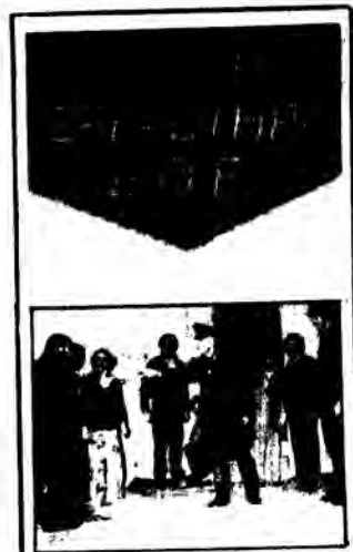
Στις 2 και 3 Φλεβάρη το Θεατρικό Εργαστήρι της ΔΟΕ δίνει τις πρώτες παραστάσεις του έργου «ΜΠΛΟΚ C» του Ηλία Βενέζη στην αίθουσα τελετών του Του Δ. Σχολείου Χολαργού.