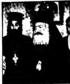
Ο αρχιεπίσκοπος Αθηνών κ. Σεραφείμ κατά την τελετή της υπογραφής της σχετικής δήλωσης με την οποία και τυπικά έγινε δωρητής σώματος.

Η ΔΟΕ εκφράζει τα ειλικρινά της συγχαρητήρια στον Αρχιεπίσκοπο για την βαθύτατη ανθρωπινή αυτή ενέργειά του η οποία, προερχόμενη από τον ηγέτη της Ελληνικής