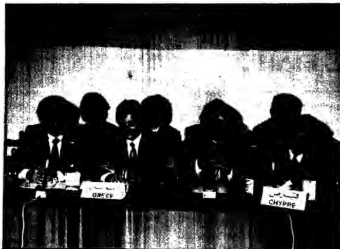
Οι αντιπροσωπείες Ελλάδας και Κύπρου στην Αίθουσα Συνεδριάσεων της Διάσκεψης της Τύνιδας.

Οι αντιπροσωπείες των εκπαιδευτικών συνδικαλιστικών οργανώσεων της Ελλάδας, Τουρκίας και Κύπρου που συμμετείχαμε, από 13-15 Δεκέμβρη 1982, στη Μεσογειακή