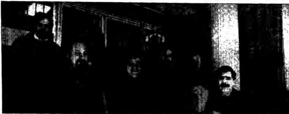
Εκπαιδευτικοί έξω από το Υπουργείο Υγείας & Πρόνοιας περιμένοντας το ραντεβού με την υπουργό

αυτή την πρακτική θα συνεχίσουμε τον αγώνα μας για να μην εφαρμοσθούν οι αυθαίρετες αυτές επιλογές. Από Δ.Ο.Ε., Ο.Λ.Μ.Ε., Π.Ο.Σ.Υ.Π.