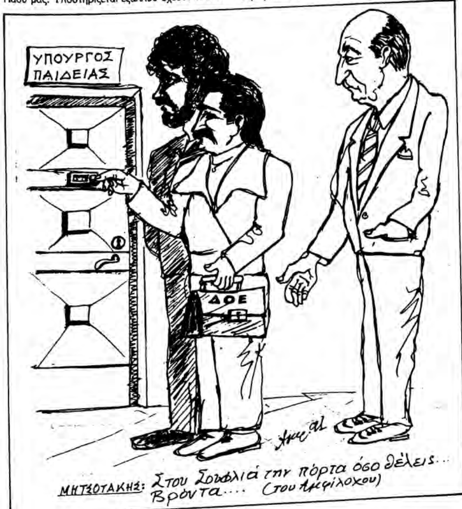
ΜΗΤΣΟΤΑΚΗΣ: Στου Σουφλίου την πόρτα όδο θέλεις... Βρόντα... (Στου Αμφίλοχου)