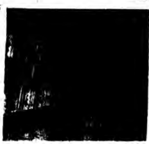
Μεταναστεύει η αίσθηση... (Caption for the image)

Πολλή εκπαιδευτική... (Main article text, partially obscured)