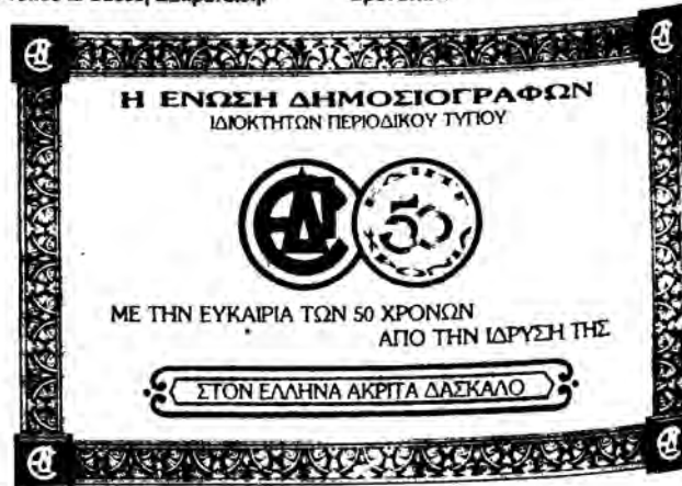
Η πλακέτα που κοσμεί ήδη το γραφείο του Προέδρου της ΔΟΕ

Η επίδοση έγινε με την ευκαιρία της συμπλήρωσης 50 χρόνων από την ίδρυση της ως άνω Ένωσης σε εόρτη τελετή που πραγματοποιήθηκε στις 9.3.1989 στο ξενοδοχείο «Μεγάλη Βρετανία».