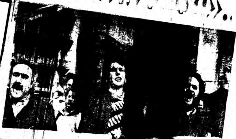
Επί και τους ίδιους στην προτομή... (Small, partially illegible text)