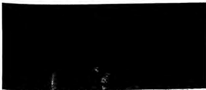
Από την ειρήνηση στη Νομική Αθήνας

Εγκλημα η κατάσταση της παιδείας και εντελώς αδίσταξη η κυβέρνηση. Βήμα καταγγελίας από τους φορείς της παιδείας χτες στη Νομική Αθήνας