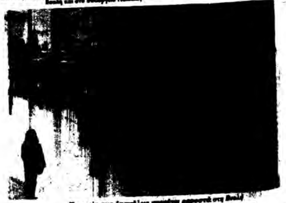
Η μορφή των δασκάλων...