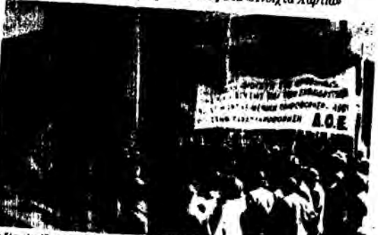
Οι δάσκαλοι έξω από το κτίριο της ΕΡΤ στην Αθήνα...