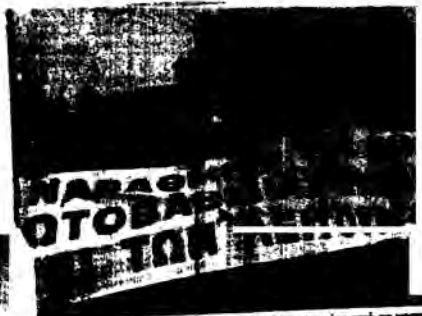
Κατάσταση και οι εργαζόμενοι...