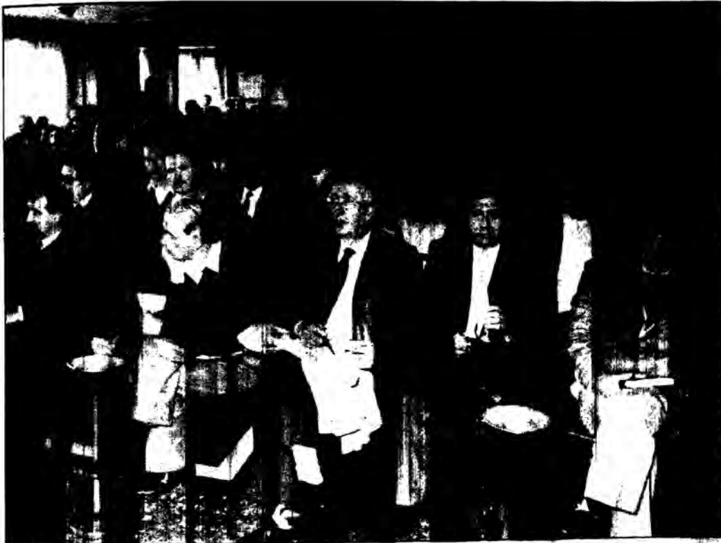
Στημιότυπο από την έκτακτη Γ.Σ. των Προέδρων Συλλόγων της χώρας στις 7/2/1989, στο «Γνωστικό Κέντρο των Ηπερωτών».