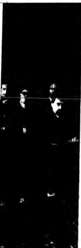
Στημότυπο από την έκτακτη Γ.Σ. των Προέδρων Συλλόγων της χώρας στις 7/2/1989, στο «Πνευματικό Κέντρο των Ηπειρωτών».