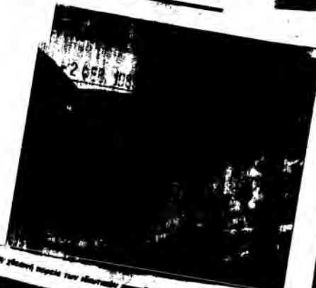
... (Small, illegible text)