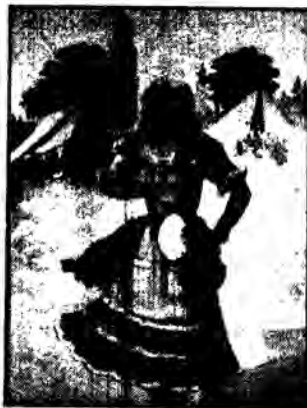
«Ο χορός της Τσιγγάνας».

Ο σύλλογος δασκάλων και Νηπιαγωγών Μεγαλοπόλεως ξεκίνησε μια αξιόπαινη πρωτοβουλία. Με εισφορές των μελών του αγόρασε ένα ακίνητο το οποίο άρχισε να ανακοδομεί με σκοπό να στεγαστεί τη δανειστική βιβλιοθήκη του, το Μουσείο, το εντευκτήριο και να δημιουργήσει ένα σύγχρονο Πνευματικό κέντρο, για κάθε μορφωτική και ψυχαγωγική εκδήλωση, του λαού της επαρχίας Μεγαλοπόλεως. Εκθεση Ζωγραφικής