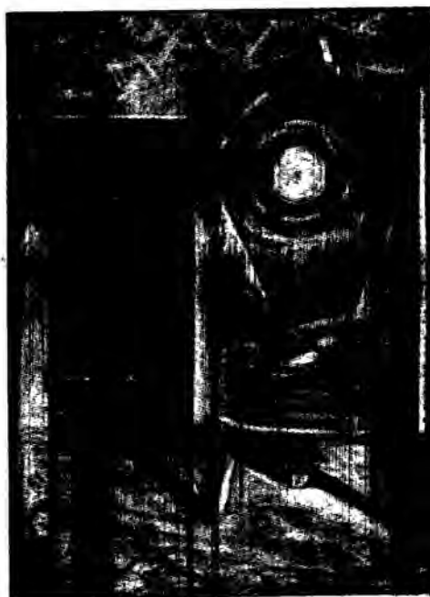
Τη Πανελλαδική έκθεση ζωγραφικής και βιβλίου με έργα δασκάλων και νηπιαγωγών (9-28, Θεσσαλονίκη 1983)

Οι δάσκαλοι και οι νηπιαγωγοί της Χώρας, ενταγμένοι στο λαϊκό κίνημα, δίνουν καθημερινά τη μάχη ενάντια στις δυνάμεις που θέλουν το λαό μας δέσμο στα συμφέροντα των «ισχυρών».