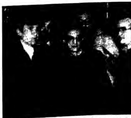
Η αντιπροσωπεία των εκπαιδευτικών στον πρωθυπουργό

Όμως υπάρχουν σοβαρές αμφιβολίες, μήπως αυτή η δεσμευση οδηγήσει ουσιαστικά στη μείωση του ποσοστού. Όπως και να έχει όμως το πράγμα, είναι απαράδεκτο σήμερα με τη γνωστή διόγκωση των