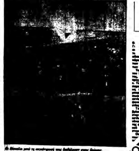
Οι δασκάλες μαζί με αναρχικούς τους διαδήλουν στους δρόμους.

ΟΙ ΚΛΕΙΣΤΑ παρέμειναν χτες οι δημοτικά σχολεία και νηπιαγωγεία της πόλης για έκτη συνεχόμενη ημέρα. Κινητή η κατάσταση του Υπουργείου Παιδείας διαμαρτυρία οι εκπαιδευτικοί.