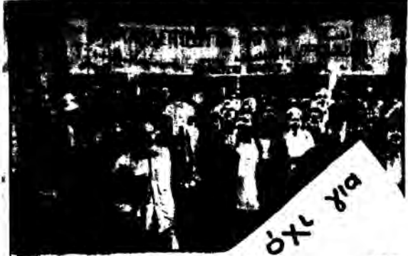
Απεργία και πορεία διαμαρτυρίας στο κεντρικό σταθμό της Αθήνας.