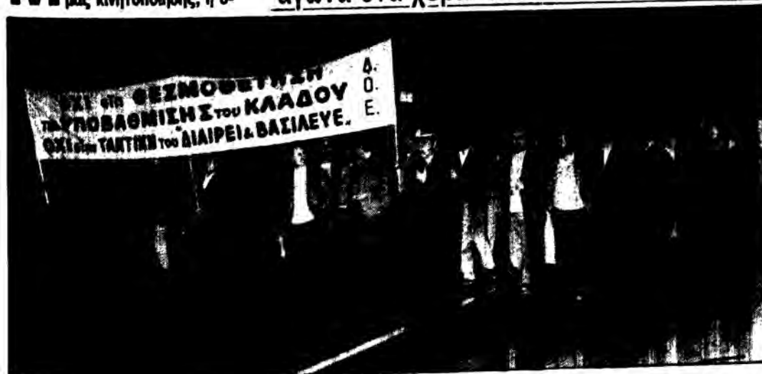
Από τη συγκέντρωση διαμαρτυρίας στις 30 Νοέμβρη 1988.

Μ ε την καθολική επιτυχία της 24ωρης απεργιακής μας κινητοποίησης, η ο-