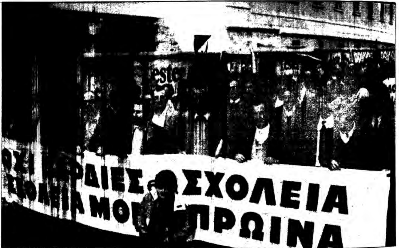
Πορεία 23 Νοέμβρη 1988