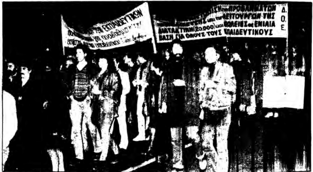
Από τη συγκέντρωση διαμαρτυρίας στις 30 Νοέμβρη 1988.

Εκτύπωση ΛΙΘΟ-ΟΦΣΕΤ-ΕΛΛΑΣ ΗΛΙΑΣ ΖΕΡΒΑΣ ΑΚΑΔΗΜΟΥ 13 - ΑΘΗΝΑ ΤΗΛ. 5222916-5238701