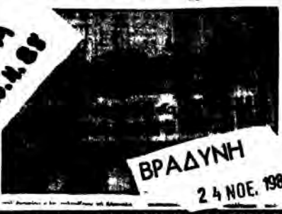
ΒΡΑΔΥΝΗ 24 ΝΟΕ. 1988