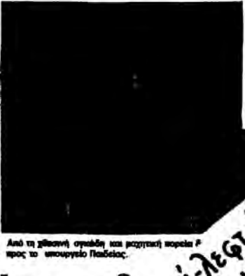
Από τη δεξιά η ομάδα και μαχητική πορεία προς το υπουργείο Παιδείας.

Μ ΑΧΗΤΙΚΗ πορεία προς το υπουργείο Παιδείας πραγματοποιήθηκε το μεσημέρι οι δασκάλες και νηπιαγωγές της 24ης Νοεμβρίου. Προηγούμενη διαδήλωση έγινε στο Βασιλειάδα όπου το Δ.Σ. της Διδασκαλικής Ομοσπονδίας Ελλάδας (ΔΟΕ) κινήθηκε εναντίον της απόφασης του Υπουργείου Παιδείας να μην καταργηθεί η διδασκαλία των μαθημάτων των μαθητών της Πρωτοβάθμιας και της Δευτεροβάθμιας εκπαίδευσης.