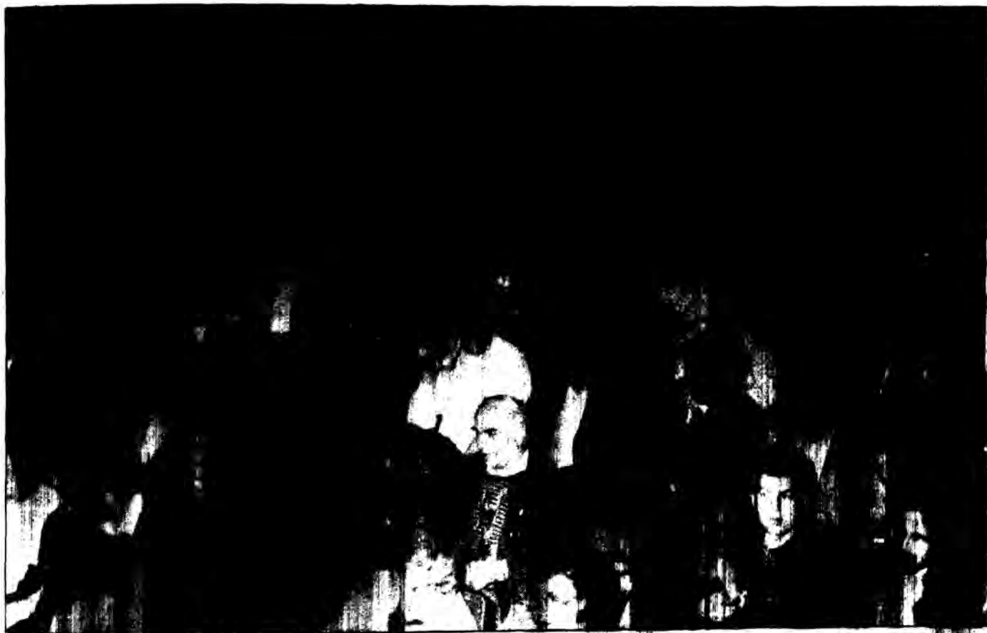
Θεάτρο «Διάννα» 23 Νοέμβρη 1988