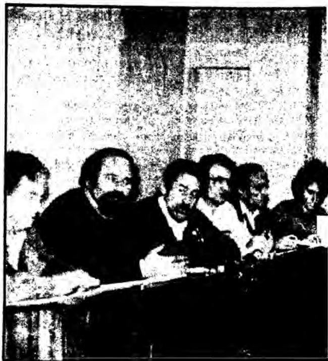
Τα προεδρεία των 4 ομοσπονδιών των εκπαιδευτικών στη συνέντευξη Τύπου

Η μείωση αντί της αύξησης των δαπανών για την