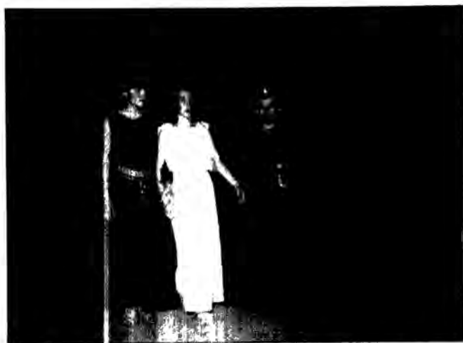
να συγχωρευτούν τα μικρά σχολεία τους πολιτιστικό κέντρο του χωριού τους. Μπράβο παιδιά ευκαιρίες στη μόρφωση. Όνειρο τους όπως λέγε, να γίνει το

Στη φωνή του Χριστού, στη φωνή του Χριστού, στη φωνή του Χριστού. Στη φωνή του Χριστού, στη φωνή του Χριστού, στη φωνή του Χριστού. Στη φωνή του Χριστού, στη φωνή του Χριστού, στη φωνή του Χριστού.