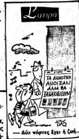
— Δύο πόρτες έχει ή ζωή —