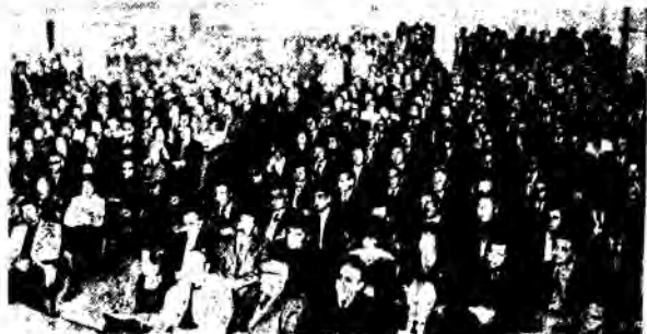
Στιγμιότυπο από την συγκέντρωση τών άπεργών - δασκάλων σέ κεντρικό βίαιτρο τών Αθηνών.

Τά λόγο έχουν οι συνάδελφοι τής Περιφέρειας τους. Αύτά για τώρα! "Αλλά θα επανέλθουμε!