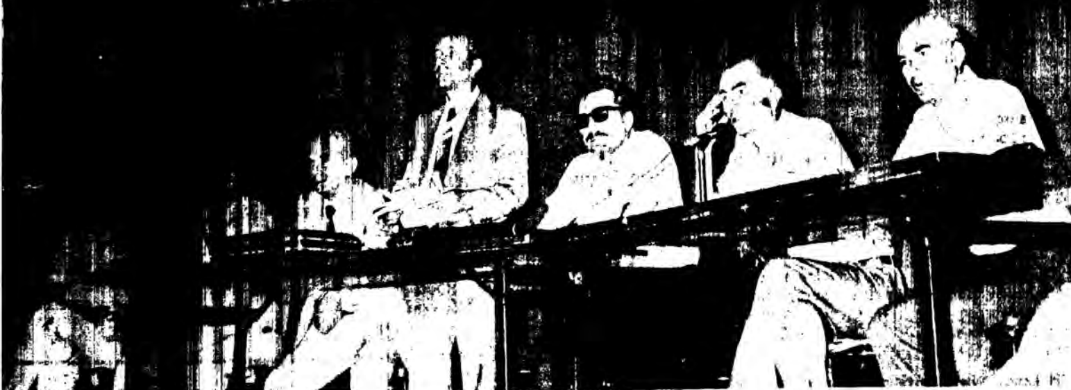
Το άπτερχόμενο διοικητικό συμβούλιο της Δ.Ο.Ε.