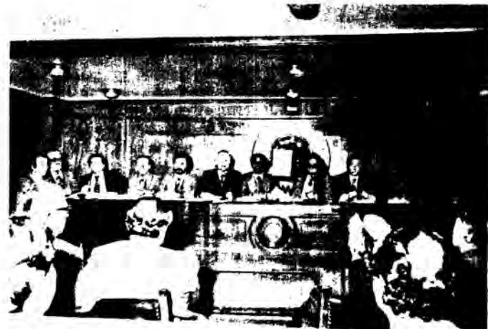
Στή 1η φωτογραφία διακρίνονται οι αντιπρόσωποι των συλλόγων που πήραν μέρος στή Γ.Σ.