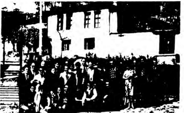
ΣΟΠΟΤΟ: Οι σύνεδροι κατά την επίσκεψή τους στο Μοναστήρι, όπου εύρισκε καταφύγιο ο ήρωας του απελευθερωτικού αγώνα κατά των Τούρκων Βασίλ Λέφσκυ.

εκπαιδευτικά προγράμματα και οι αλλαγές του εκπαιδευτικού συστήματος. Μέσα απ αυτήν πάλι ξαναγυρίζουν στο Υπουργείο με τις παρατηρήσεις, προτάσεις και τροποποιήσεις για να γίνουν Νόμοι του Κράτους. Οι Εκπρόσωποι μας επισήμαναν ακόμα πώς οι Βούλγαροι δάσκαλοι προετοιμάζονται για το λειτουργήμα τους στο Πανεπιστήμιο και ειδικεύονται στο γνωστικό αντικείμενο που πρόκειται να διδάξουν. Αξίζει να σημειώσουμε τέλος, την εγκάρδια φιλοξενία, τη συναδελφική ατμόσφαιρα και το δημοκρατικό διάλογο που εξασφάλισαν η οργανωτική επιτροπή και οι συντάχτες της «Ουτσιτελσκο Ντέλλο» σε όλη τη διάρκεια της διάσκεψης.