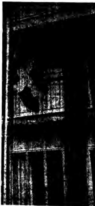
Τό 4ο Δ.Σ. Σταυρουπόλεως στεγάζεται σέ τριώροφη πολυκατοικία.