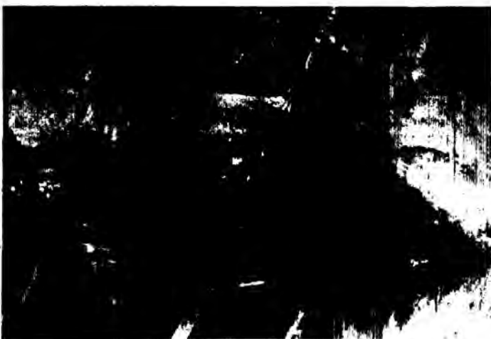
Εδώ πίνουν νερό οι μαθητές... και χτυπά η ηπατιτίδα.