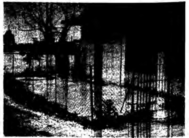
1ο Νηπιαγωγείο Έλευθεριών (Κορβελίω). Μερσάτ ή αλλη περιφραγμένη