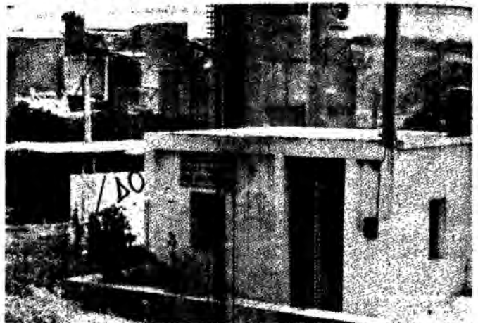
Κοσ' αυτό τό «ουγγρικό» σχολείο θά εφαρμόσει ή ανέβρση τὰ νέα μέτρα Σχολεία Νέας Δίκαρνας σέ μέ φόντο τό ταιμεντάδιο.