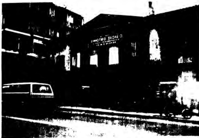
Δίπλα άπό τόν κεντρικό δρόμο και πάνω άπό τά εμπορικά λειτουργεί τό 3ο Δ.Σ. Πατρών.

Όπως είναι γνωστό εκατομμύρια δρχ. διαθέτει ο Υπουργός Οικονομικών κατά τήν απόλυτη κρίση του σέ διάφορες οργανώσεις (γράφουμε σέ άλλες στήλες σχετικά) με κομματικά και μόνο κριτήρια διασπαθίζοντας τό δημόσιο χρήμα.