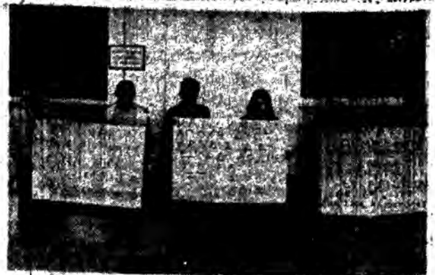
Διακοσμημένοι οι μικροί μαθητές γιά τὰ χόλια τού καινούργιου σχολείου τους...

ΔΟΤΙΟΧΗ 800 ΜΑΘΗΤΩΝ ΣΤΗΝ ΗΛΙΟΥΠΟΛΗ ΘΕΣΣΑΛΟΝΙΚΗΣ