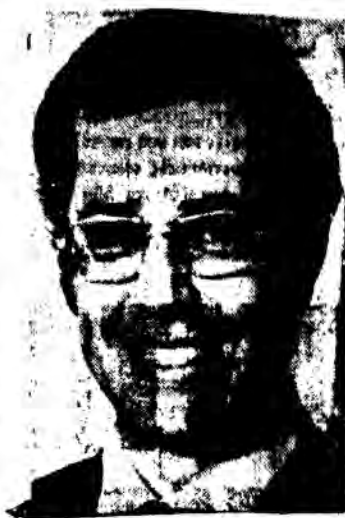
Ὁ Υπουργὸς Παιδείας τῆς Κύπρου Χ. Σοφιανός

ΕΡ. Πῶς ἀντιλαμβάνεστε τὸ ρόλο πού μπορεῖ νὰ διαδραματίσει ἡ πα-