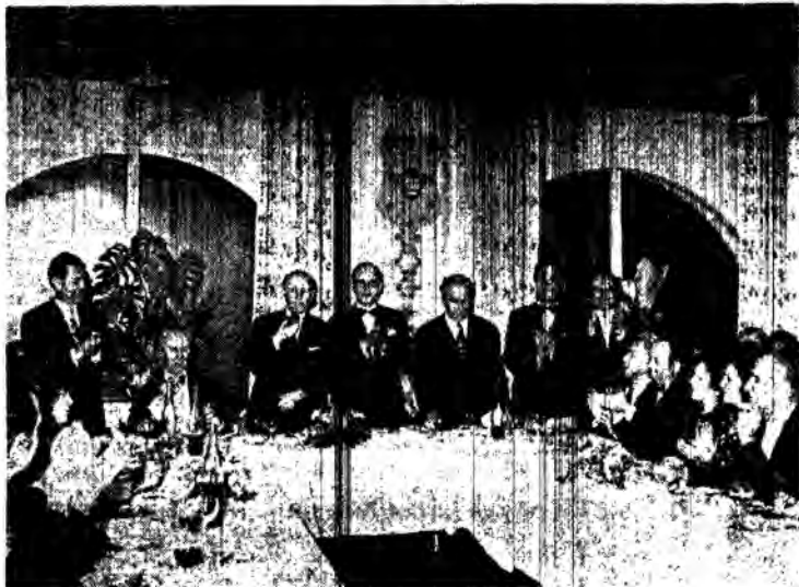
Τὸ τραπέζι τῶν ἐπισημῶν. Ὁ κ. Υπουργός, ἐνῶ ἀπευθύνει χαιρετισμὸν, καταφανῶς συγκεκλινημένος.

Μὲ ἐξαιρετικὴν ἐπιτυχίαν — πρωτοφανῆ εἰς τὴν Ἱστορίαν τοῦ Διδασκαλικοῦ συνδικαλισμοῦ— ἐδόθη εἰς τὴν πολυτελεστάτην αἴθουσαν τοῦ Ξενοδοχείου ΗΛΕΚΤΡΑ ΠΑΛΛΑΣ τῆς Θεσσαλονίκης, τὸ ἑσπέρας τῆς 17ης λήγοντος, ἡ χοροεσπερίε τῆς Δ.Ο.Ε. ὑπὸ τὴν προστασίαν τοῦ Υπουργοῦ μας κ. Νικολάου Γκαντώνα. Ἦτο μία ἐκδήλωσις, ἡ ὁποία ὑπερέβη κάθε προσδοκίαν καὶ τῶν πλέον αἰσιοδόξων ἀκόμη. Ὁ Διδάσκαλος εἰς τὴν πρώτην γραμμὴν τοῦ ἐνδιαφέροντος τοῦ Ἑλληνικοῦ κοινοῦ. Εἰς τὴν Θεσσαλονικὴν συνεζητεῖτο εὐρέως, ὡς τὸ σπουδαιότερον κοσμικὸν γεγονός. Ἡ συμμετοχὴ τῶν συναδέλφων τῆς Βορείου Ἑλλάδος ὑπῆρξεν πρωτοφανῆς. Μεγάλος συνωστισμὸς παρατηρήθη μεταξύ τῶν συναδέλφων διὰ τὴν ἐξασφάλισιν θέσεων εἰς τὴν μεγαλειώδη χοροεσπερίδα τοῦ Κλάδου.