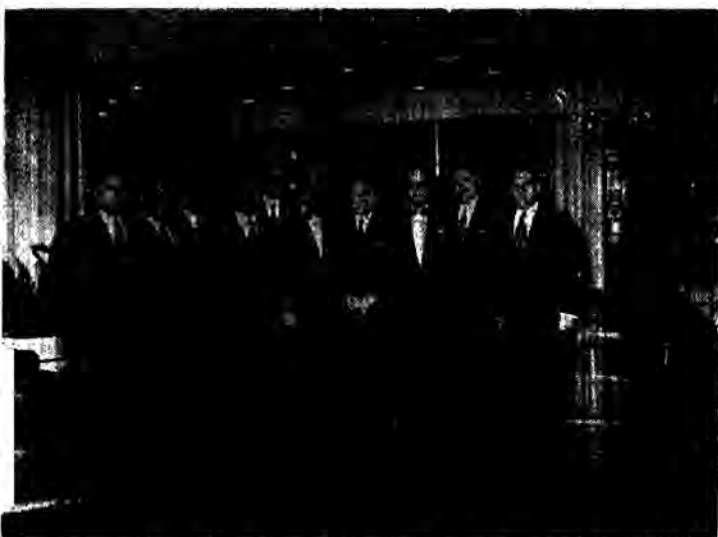
Ο κ. Υπουργός μας, ἐν μέσῳ τῶν μελῶν τοῦ Διοικητικοῦ Συμβουλίου τῆς Διδασκαλικῆς Ὀμοσπονδίας τῆς Ἑλλάδος εἰς τὴν εἰσοδὸν τοῦ Ξενοδοχείου.