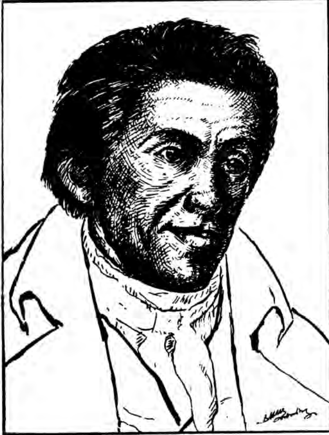
Henri Pestalozzi (1746—1827)

Θά προλογίσει το άρθρον μας ο διασημότερος από τους νεωτέρους Βιογράφους του Pestalozzi, ο Έλβετός εκπαιδευτικός Βονεϊ.