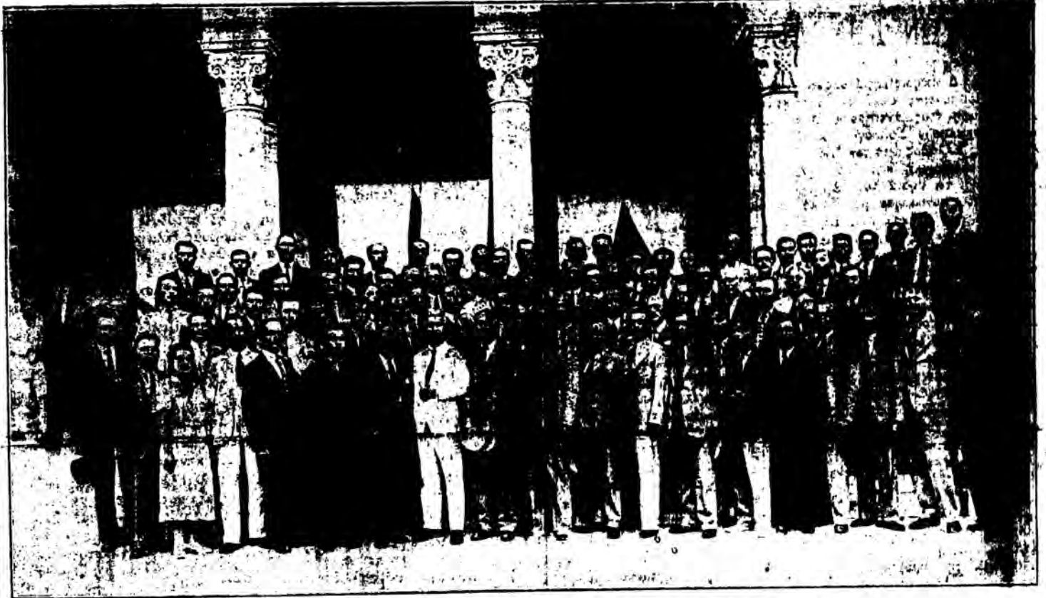
ΙΖ' ΓΕΝΙΚΗ ΣΥΝΕΛΕΥΣΙΣ ΔΙΔ. ΟΜΟΣΠΟΝΔΙΑΣ

κίνησις - 9) Οἱ τελευταῖες εἰδήσεις μας : Γόρω ἀπὸ τὰς συζητήσεις τῆς ΙΖ' γεν. συνέλευσεως, 'Ἡ Νέα Διοίκησις ἐνώπιον τοῦ κ. Ὑπουργοῦ τῆς Παιδείας, Γάλλοι δημοῖοι ἐκδρομαὶ εἰς 'Ελλάδα, 'Ἐνστασις κατ' ἀποφάσεως τῆς ΙΖ' Γενικῆς Συνελεύσεως.