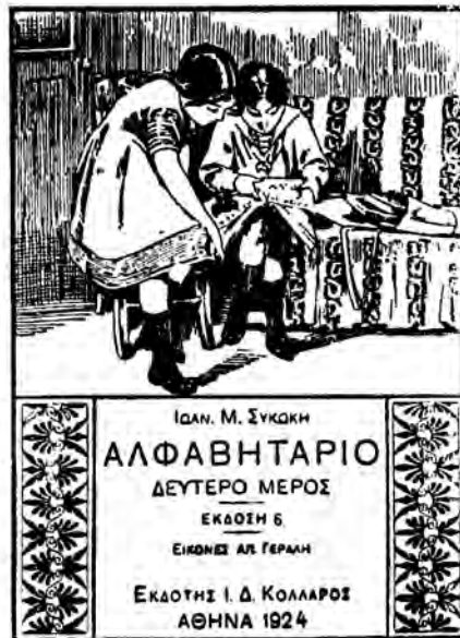
Συνώκη ΑΛΦΑΒΗΤΑΡΙΟ Μέρος Β'

Τὸ ἀλφάβηταριο Συκώκη «ἡ Ἑλλη» ὅπως τὸ βιβλίον οἱ μικροὶ τοῦ φίλου εἶναι τὸ πῶς χαριτωμένο βιβλίον ἅπ' ὅσα πῆραν ὡς τώρα στὰ χέρια τους τὰ παιδιὰ μας. Οἱ ὀλοζώντανες σκηνές του, παρμένες ἀπὸ μέσα ἀπὸ τὴν παιδικὴ ζωὴ, οἱ καλλιτεχνικὲς εἰκόνες του καὶ τὸ πολυχρῶμο ἐξώφυλλο του δίνουν στὸ ἀλφάβηταριο αὐτὸ ὄψη βιβλίου εὐρωπαϊκοῦ, ἔργου πολὺ σπάνιου γιὰ τὴν πατρίδα μας καὶ ἀληθινὰ καλλιτεχνικοῦ.