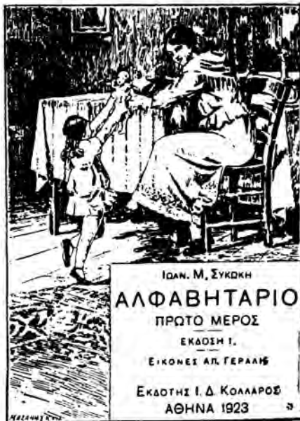
Συνώκη ΑΛΦΑΒΗΤΑΡΙΟ Μέρος Α'

Τὸ ἀλφάβηταριο Συκώκη «ἡ Ἑλλη» ὅπως τὸ βιβλίον οἱ μικροὶ τοῦ φίλου εἶναι τὸ πῶς χαριτωμένο βιβλίον ἅπ' ὅσα πῆραν ὡς τώρα στὰ χέρια τους τὰ παιδιὰ μας. Οἱ ὀλοζώντανες σκηνές του, παρμένες ἀπὸ μέσα ἀπὸ τὴν παιδικὴ ζωὴ, οἱ καλλιτεχνικὲς εἰκόνες του καὶ τὸ πολυχρῶμο ἐξώφυλλο του δίνουν στὸ ἀλφάβηταριο αὐτὸ ὄψη βιβλίου εὐρωπαϊκοῦ, ἔργου πολὺ σπάνιου γιὰ τὴν πατρίδα μας καὶ ἀληθινὰ καλλιτεχνικοῦ.