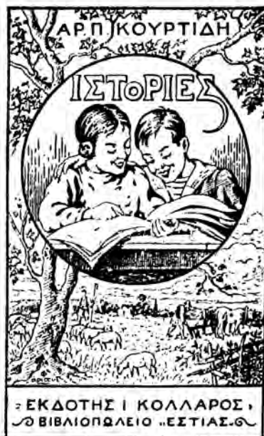
Α. Κουρετίδη «ΙΣΤΟΡΙΕΣ» Ἀναγνωστικὸ τῆς Η' τοῦ Δημοτικοῦ

Καὶ ἡ Σ. Ἐπιτροπὴ τοῦ διαγωνισμοῦ καὶ δλόκληρος ὁ ἑλληνικὸς τύπος ἔχουν γράψει μετὰ μεγάλο ἐνθουσιασμὸ γιὰ τὸ θαυμάσιον αὐτὸ βιβλίον. Ὅλοι συμφωνοῦν πῶς εἶναι ἓνα ἀπὸ τὰ παιδαγωγικώτερα Ἀναγνωστικὰ πού ἐγράφησαν γιὰ τοὺς μαθητὰς τῆς Β' τοῦ Δημοτικοῦ. Πρὸ πάντων ἐκθειάζουν τὴ βαθυτάτη ἐπίδραση πού θὰ ἔχη τὸ χαριτωμένο αὐτὸ βιβλίον στὴν ψυχὴ τῶν παιδιῶν καὶ τὸν ἔξοχο χαρακτήρα τοῦ Γιωργάκη πού γιὰ πολλὰ πολλὰ χρόνια θὰ μείνη ζωντανὸς στὶς ψυχὰς, τους καὶ θὰ τὶς ὀδηγεῖ πάντα στὸ καλὸ καὶ στὸ εὐγενές.