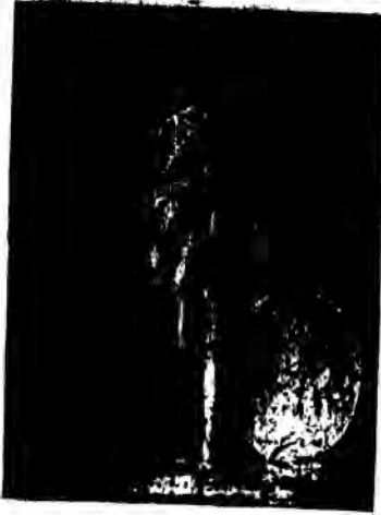
Ο Ρουσό και ο Αιμίλιος

... Κάνετε το μαθητή σας να προεξέη τα φυσικά φαινόμενα κι άμεσα θα τον κινήσετε την περιέργεια. Μά για να τή θρέψετε, μη βιασθήτε να την ικανοποιήσετε. Βάλτε τα προβλήματα μπροστά στη διανοητική του δύναμη κι αφήστε τα να τα βάλουν.