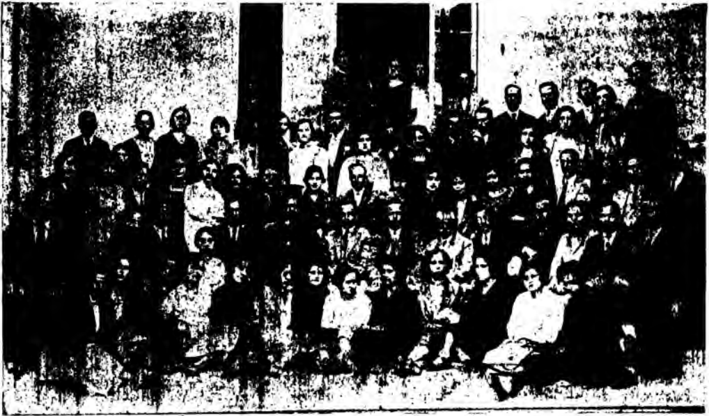
Ἡ Συνέλευσις τοῦ Συλλόγου Ἡρακλείου ποὺ ἀποδοκίμασε τὸ κίνημα.

Κύριοι Συνάδελφοι, Ἠνωμένοι μέχρι τοῦθδε διὰ τῆς Ὀμοσπονδίας μας εἰχομεν κατορθώσει πολλὰ νὰ ἐπιτύχωμεν καὶ ἡ διάσπασις δὲν εἶναι βέβαια ἐκείνη, ἣτις θὰ μᾶς πραγματοποιήσῃ τοὺς πόθους μας καὶ θὰ μᾶς φέρῃ μίαν καλύτεραν ἀφῆσιν διὰ τὸ Δημοτικὸν σχολεῖον καὶ τὸν διδασκαλον, οὕτως ἐκείνη ἣτις θὰ διατηρήσῃ τὰ κερημένα ἤδη. Εἶναι τόσοσιν δύσκολον εἰς τὴν πρᾶξιν τό: «ἡ ἰσχύς ἐν τῇ ἐνώ-