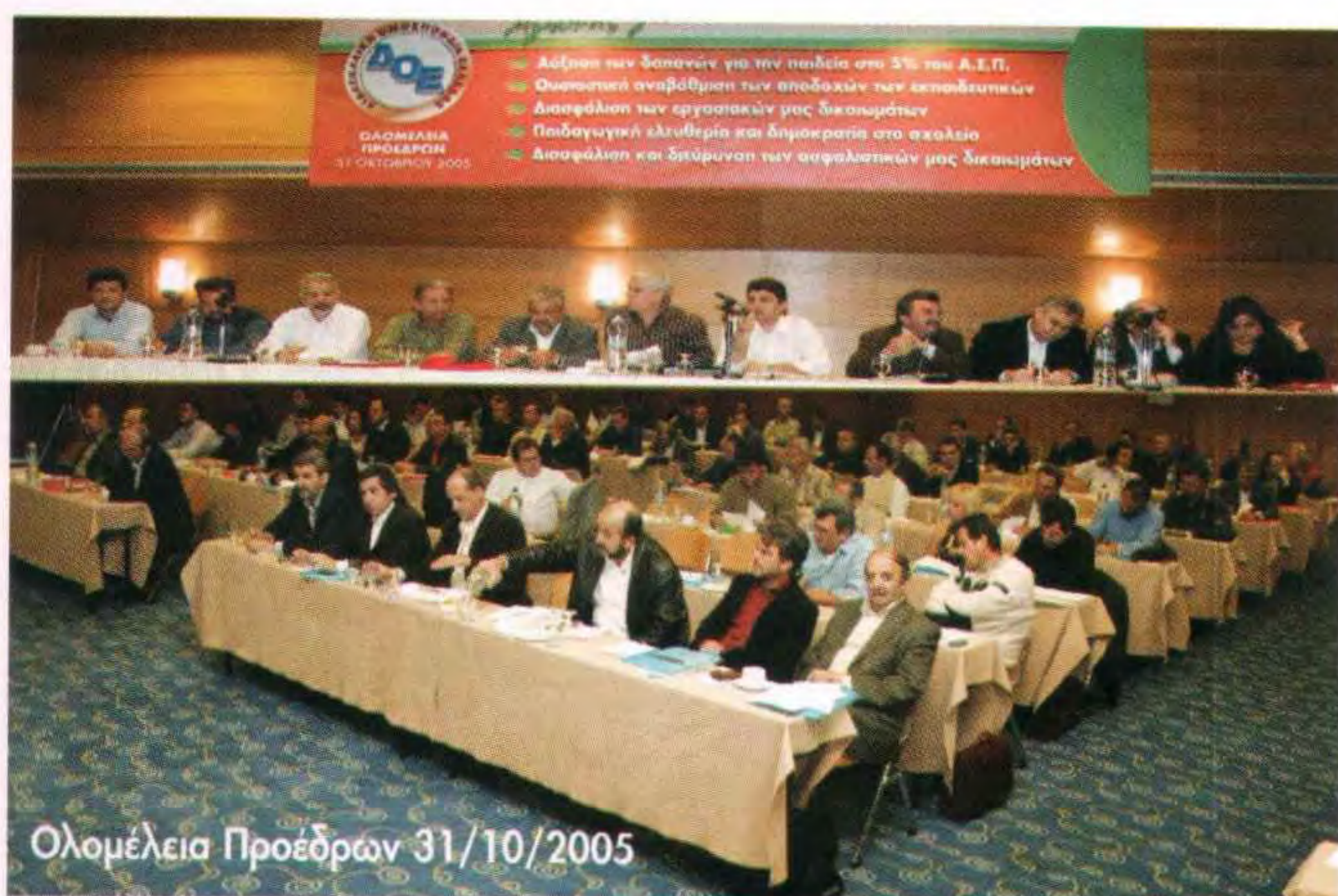
Ολομέλεια Προέδρων 31/10/2005