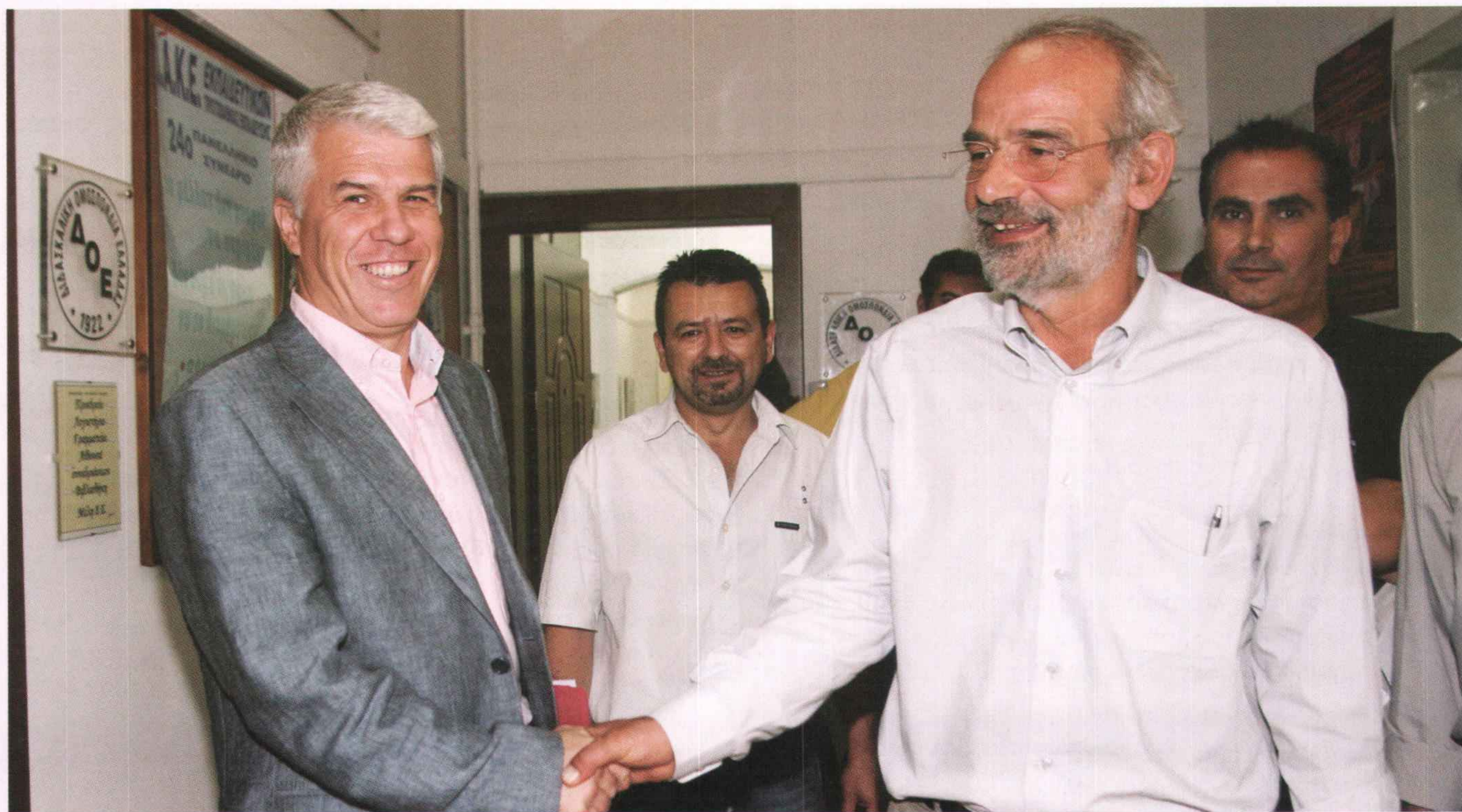
Από τη συνάντηση του Δ.Σ. της Δ.Ο.Ε. με τον Πρόεδρο του Συνασπισμού, κ. Αλέκο Αλαβάνο.

ΔΙΝΟΥΜΕ ΤΟΝ ΑΓΩΝΑ ΓΙΑ ΝΑ ΦΕΡΟΥΜΕ ΤΗΝ ΠΑΙΔΕΙΑ ΚΑΙ ΤΟΝ ΕΚΠΑΙΔΕΥΤΙΚΟ ΣΤΗ ΘΕΣΗ ΠΟΥ ΤΟΥΣ ΠΡΕΠΕΙ!!!