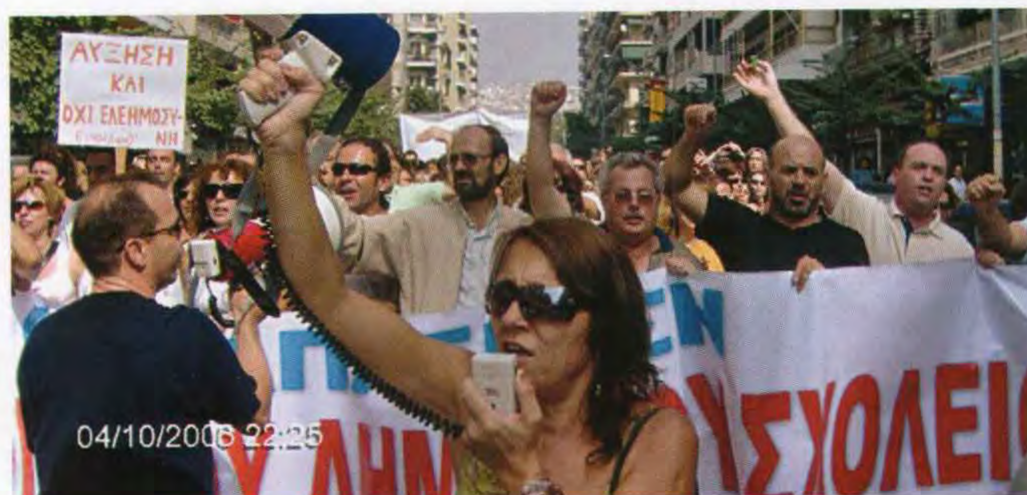
Η απεργία στη Θεσσαλονίκη.

Το Δ.Σ. της Δ.Ο.Ε., ύστερα από τα παραπάνω: