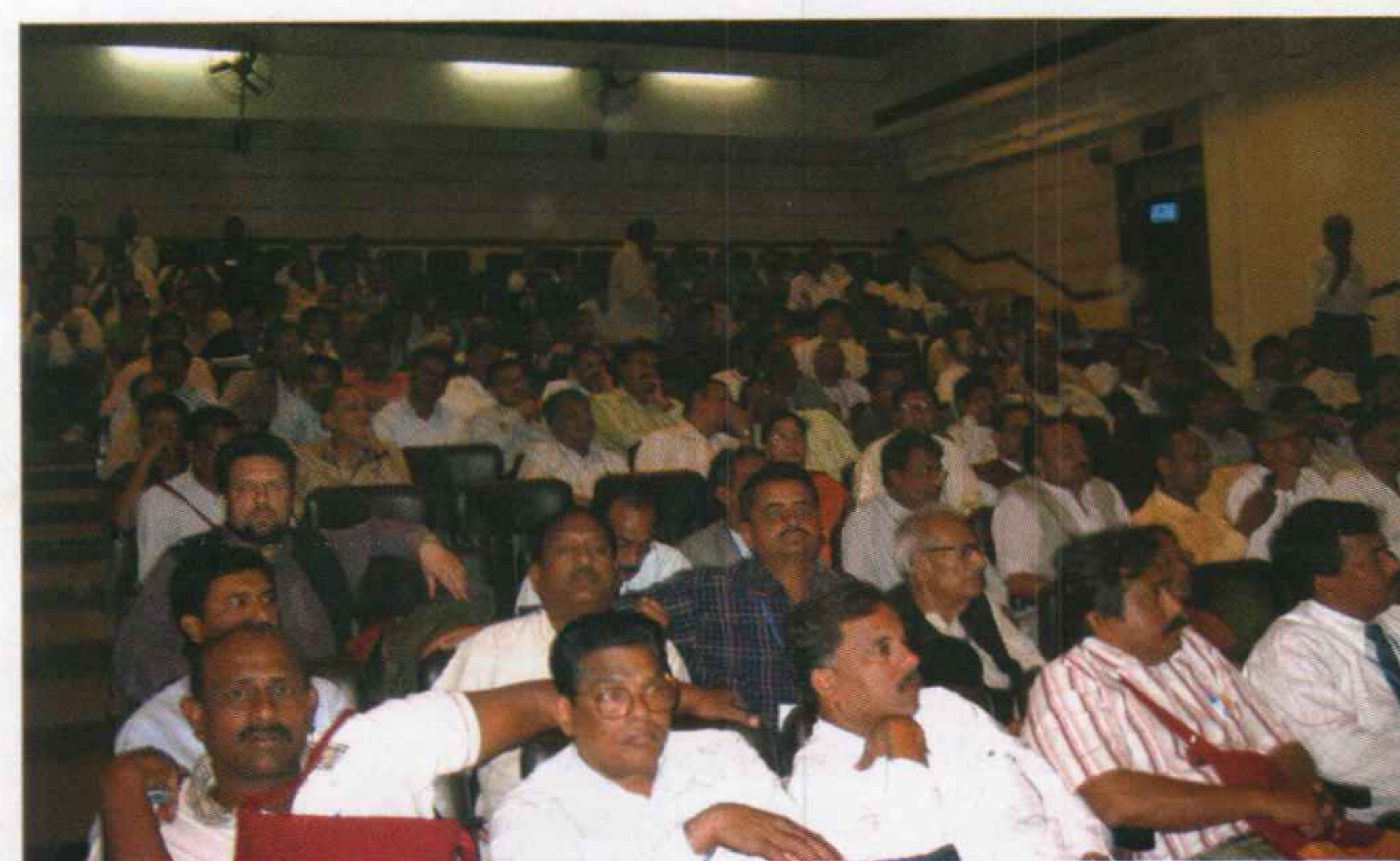
Από τις εργασίες της Συνδιάσκεψης.