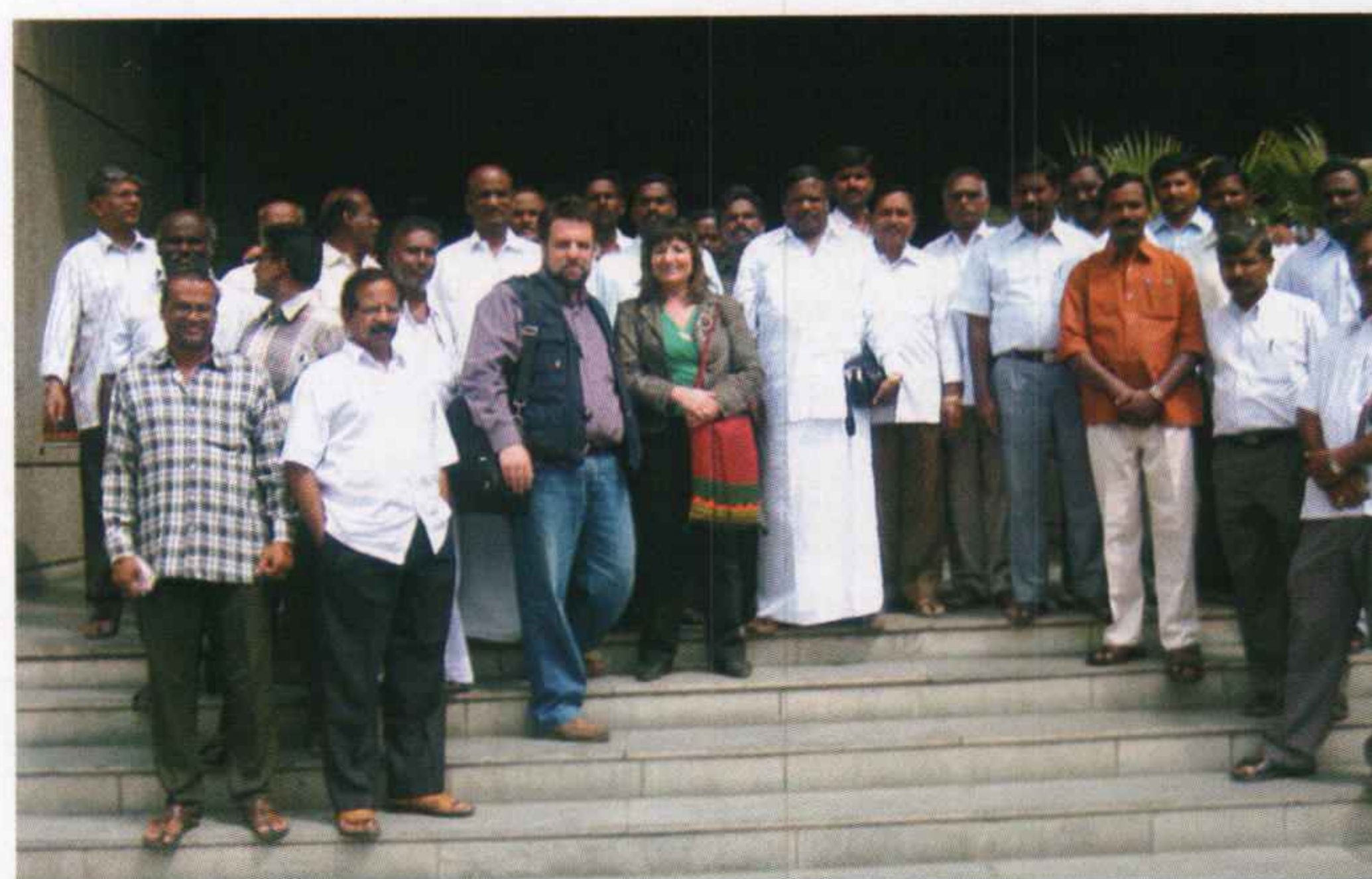
Με αντιπροσώπους από Ινδία, Μπαγκλαντές και Νεπάλ.