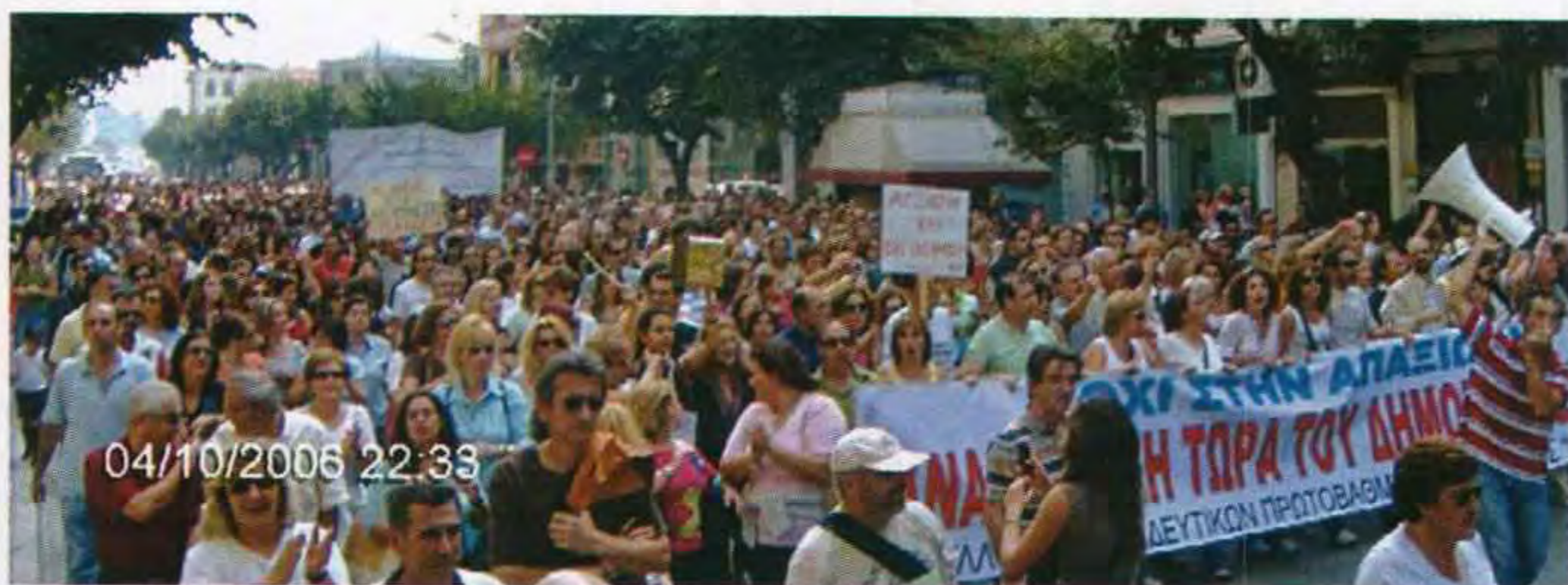
Η απεργία στη Θεσσαλονίκη.