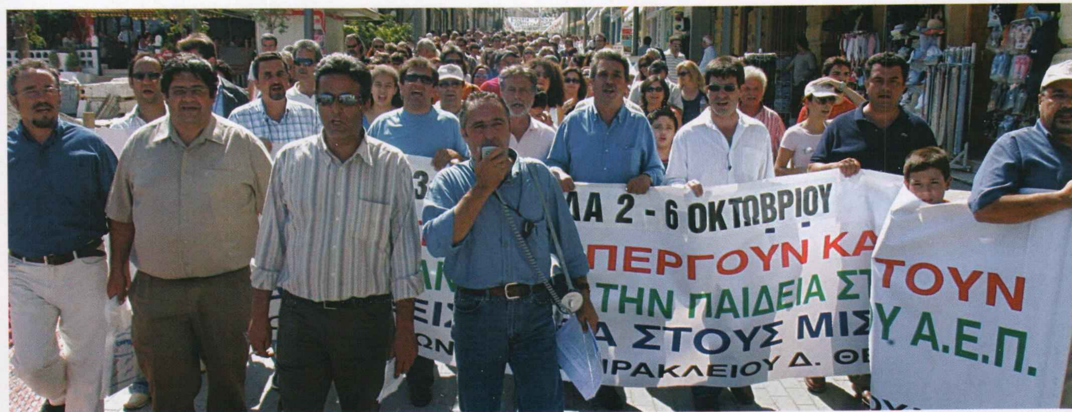
Η απεργία στο Ηράκλειο